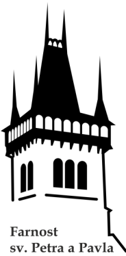
Farnost sv. Petra a Pavla

Bohoslužby v Semilech se konají v děkanském kostele sv. Petra a Pavla (KO), v kapli sv. Zdislavy na faře (KA), ve filiálním kostele Umučení sv. Jana Křtitele na Koštofranku (KK), v domově důchodců (DD), v kapli sv. Antonína v Chuchelně (CH).