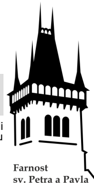
Farnost sv. Petra a Pavla

Bohoslužby v Semilech se konají v děkanském kostele sv. Petra a Pavla (KO), v kapli sv. Zdislavy na faře (KA), ve filiálním kostele Umučení sv. Jana Křtitele na Koštofranku (KK), v domově důchodců (DD), v kapli sv. Antonína v Chuchelně (CH).