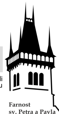
Farnost sv. Petra a Pavla

Bohoslužby v Semilech se konají v děkanském kostele sv. Petra a Pavla (KO), v kapli sv. Zdislavy na faře (KA), ve filiálním kostele Umučení sv. Jana Křtitele na Koštofranku (KK), v domově důchodců (DD), v kapli sv. Antonína v Chuchelně (CH).