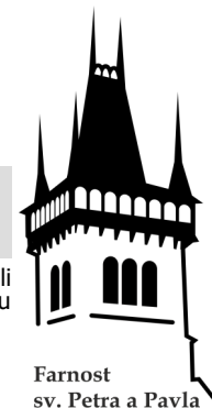
Farnost sv. Petra a Pavla

Bohoslužby v Semilech se konají v děkanském kostele sv. Petra a Pavla (KO), v kapli sv. Zdislavy na faře (KA), ve filiálním kostele Umučení sv. Jana Křtitele na Kostofranku (KK), v domově důchodců (DD), v kapli sv. Antonína v Chuchelně (CH).