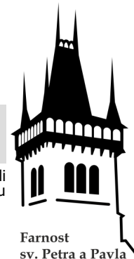
Farnost sv. Petra a Pavla

Bohoslužby v Semilech se konají v děkanském kostele sv. Petra a Pavla (KO), v kapli sv. Zdislavy na faře (KA), ve filiálním kostele Umučení sv. Jana Křtitele na Kostofranku (KK), v domově důchodců (DD), v kapli sv. Antonína v Chuchelně (CH).