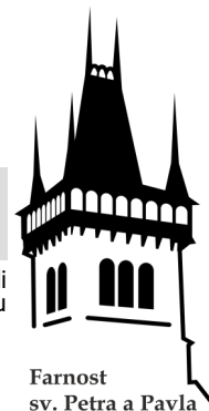
Farnost sv. Petra a Pavla

Bohoslužby v Semilech se konají v děkanském kostele sv. Petra a Pavla (KO), v kapli sv. Zdislavy na faře (KA), ve filiálním kostele Umučení sv. Jana Křtitele na Kostofranku (KK), v domově důchodců (DD), v kapli sv. Antonína v Chuchelně (CH).