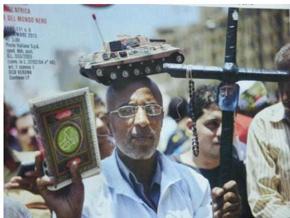
Foto z titulní strany zářijového čísla comboniánského magazínu Nigrazia.