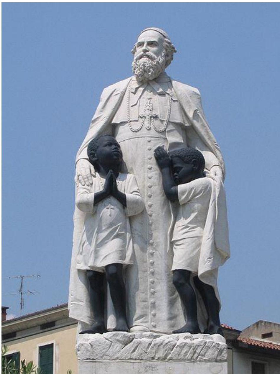
Socha sv. Daniele Comboniho v italské Veroně, kde se zrodilo jeho povolání.