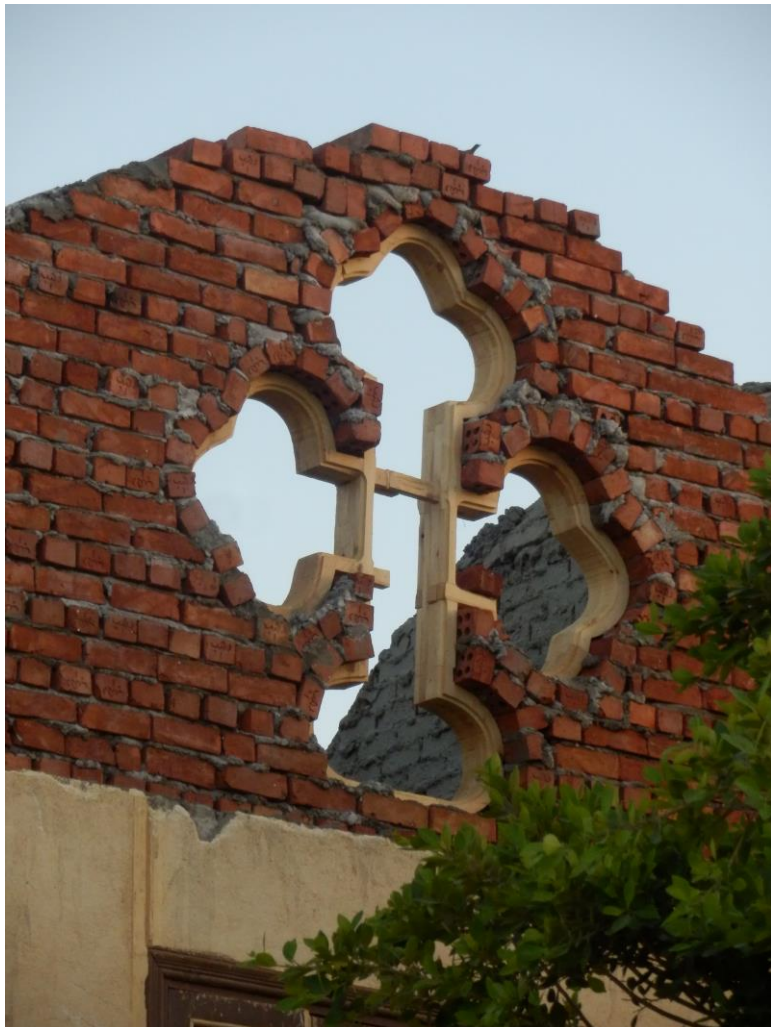
Fotografie z rozestavěného koptského kláštera sv. Simeona nedaleko Asuánu.