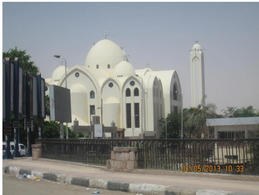
Pohled na koptskou ortodoxní katedrálu Archanděla Michaela v Asuánu.