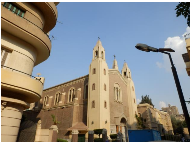
Svatý Josef v az-Zamálku