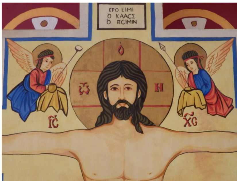
Muž, který zemřel a vstal z mrtvých. Muž, kterého křesťané následují až i k prolití krve.