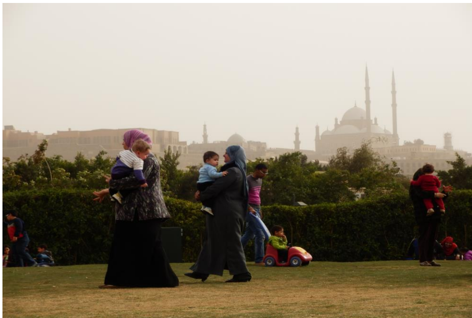
Z pozice sedu vyfocen pohled na káhirskou Citadelu v pátečním odpoledni.