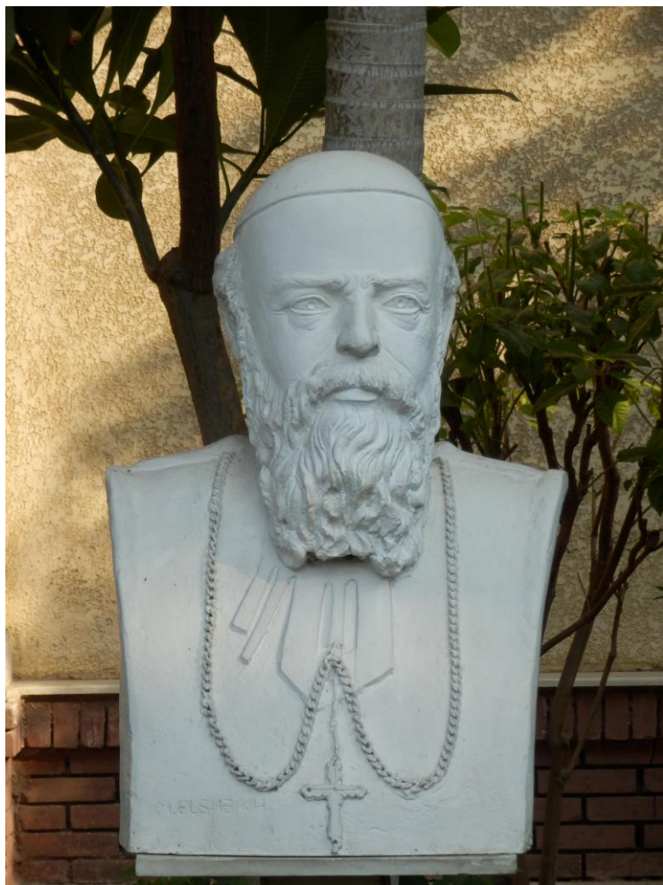
Busta sv. Daniele Comboniho na zahradě Dar Comboni for Arabic Studies v Káhiře.