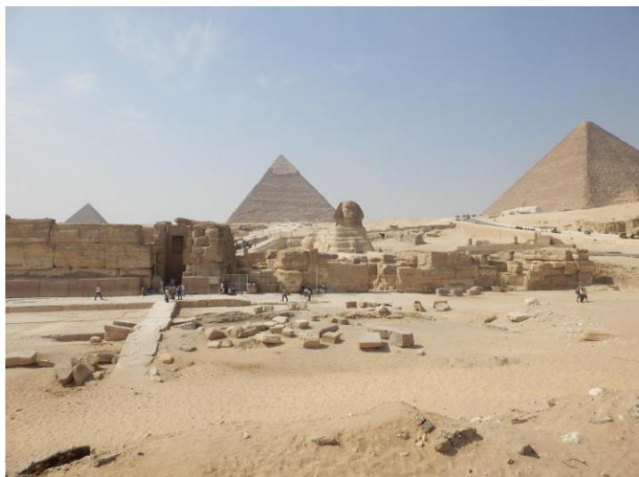
Závěrečná fotka: pohled na pyramidové panorama v Gíze se sfingou..