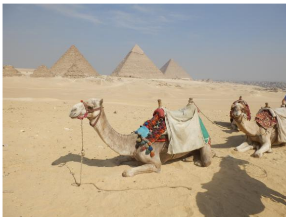
Na snímku: Mojžíš při jedné z přestávek v naší cestě... do kamery hledí Mickey Mouse