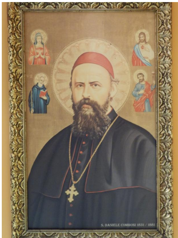
Obraz sv. Daniele Comboniho z kaple v Dar Comboni.